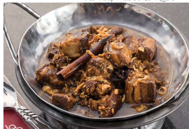
Phuket Moo Hong