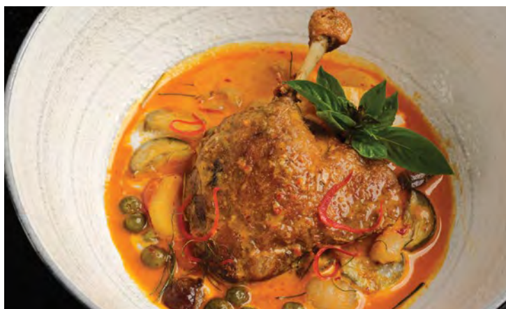
Gang Phed Ped Yang

Пожалуйста, сообщите нам если у вас есть аллергия на какие либо продукты питания или специальная диета