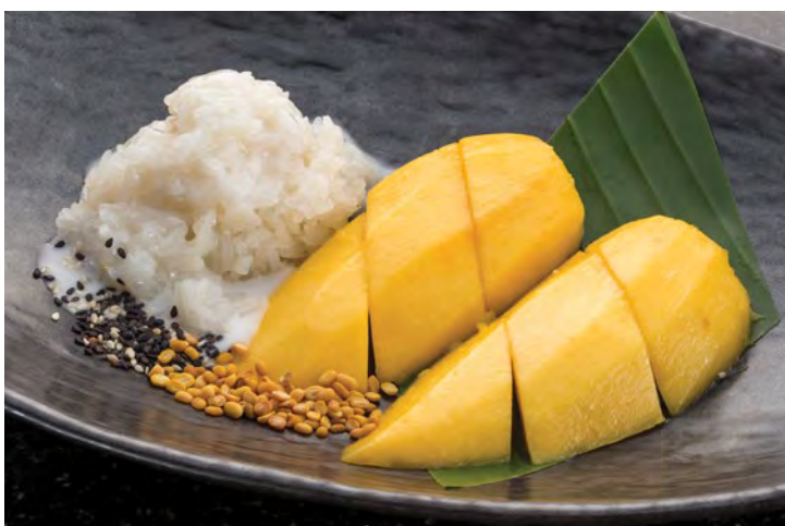
Khao Niew Ma Muang

Пожалуйста, сообщите нам если у вас есть аллергия на какие либо продукты питания или специальная диета