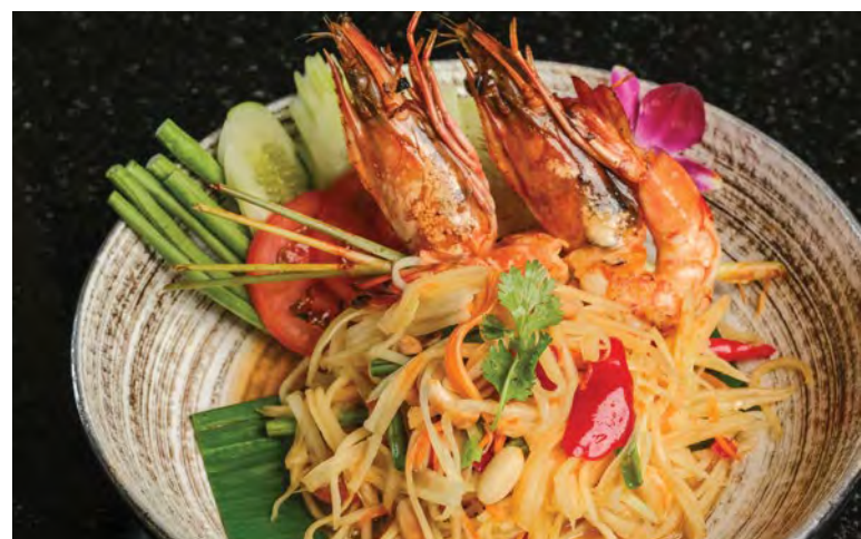
Som Tum Thai