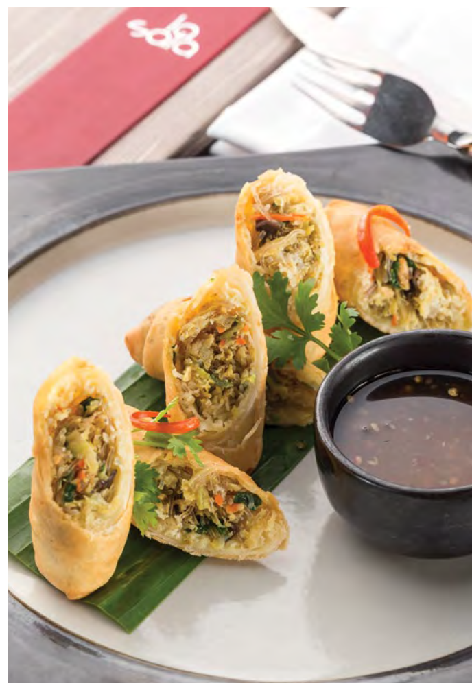
Por Pia Poo Thod