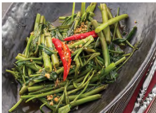
Phad Pak Boong Fai Daeng