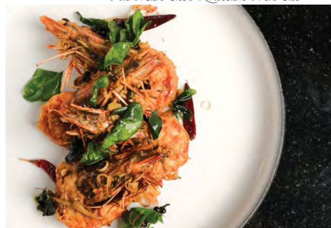
Goong Pad Char