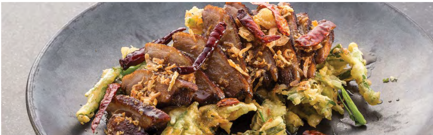
Ped Yang Naam Ma-Kham

Пожалуйста, сообщите нам если у вас есть аллергия на какие либо продукты питания или специальная диета