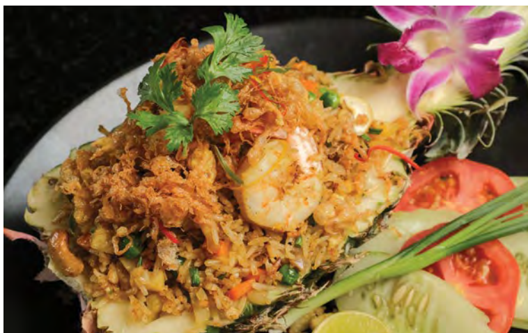
Phuket Fried Rice