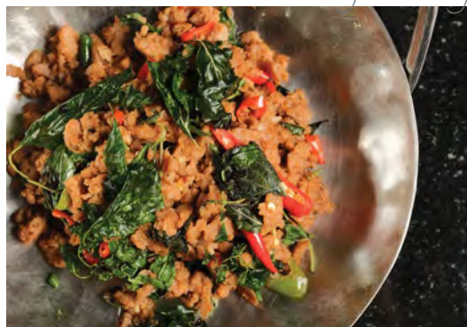
Phad Kapraow Jay