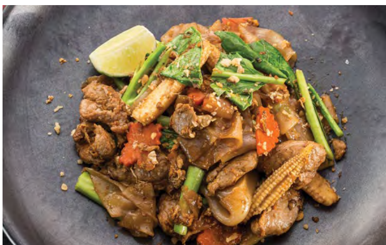
Phad see Eiw Moo

Пожалуйста, сообщите нам если у вас есть аллергия на какие либо продукты питания или специальная диета