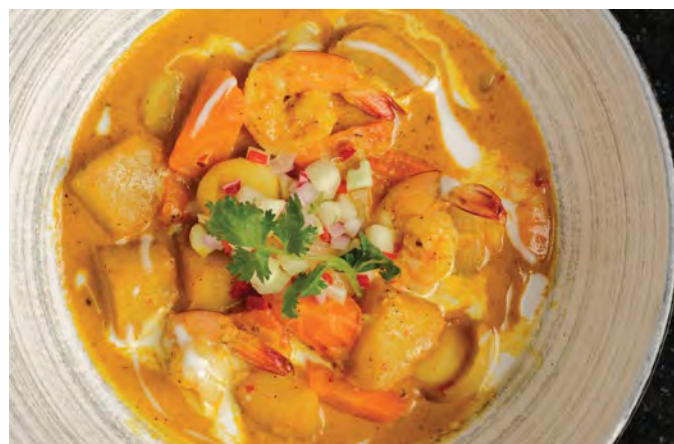
Gang Kalee Goong