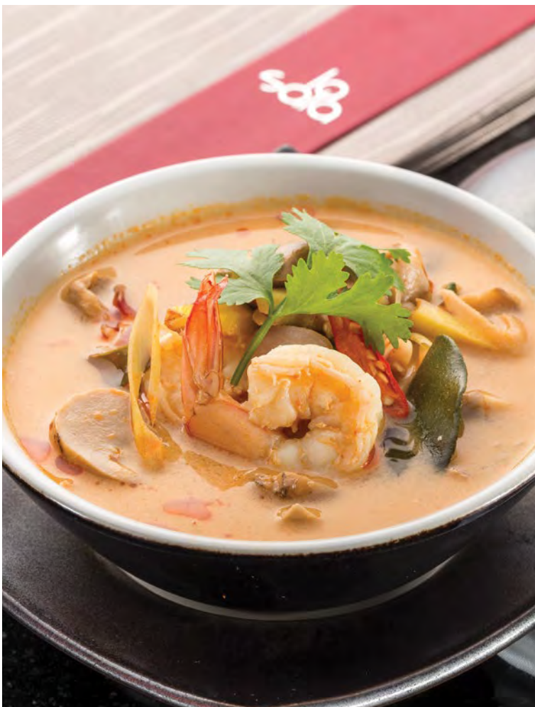
Tom Yum Goong Nam Kon

Пожалуйста, сообщите нам если у вас есть аллергия на какие либо продукты питания или специальная диета