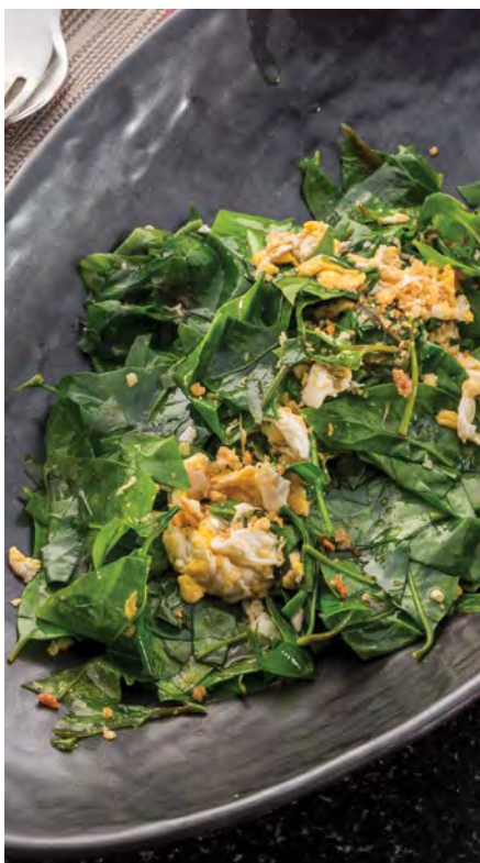
Phad Pak Miang Khai

Пожалуйста, сообщите нам если у вас есть аллергия на какие либо продукты питания или специальная диета