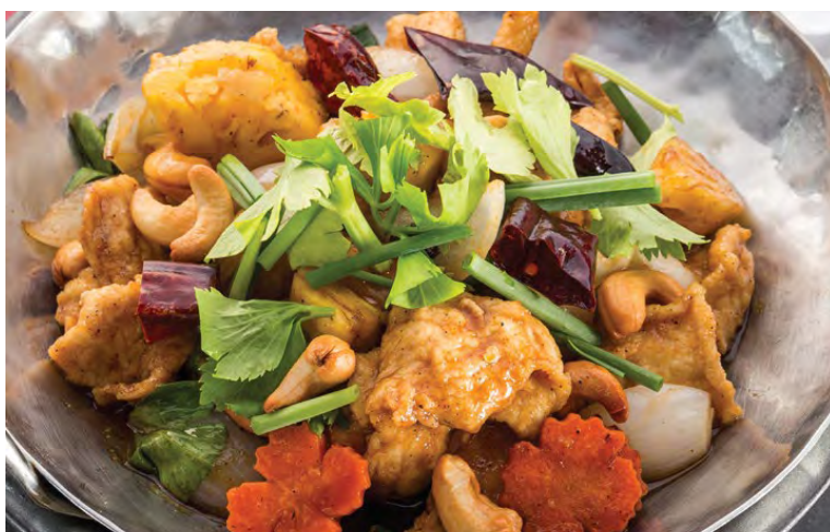
Gai Phad Med Mamuang

Пожалуйста, сообщите нам если у вас есть аллергия на какие либо продукты питания или специальная диета