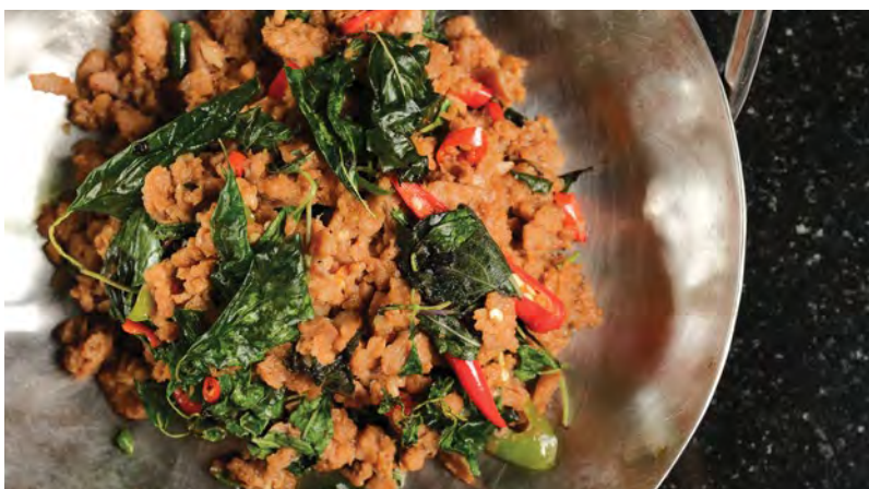
Phad Kra Prao Nuea