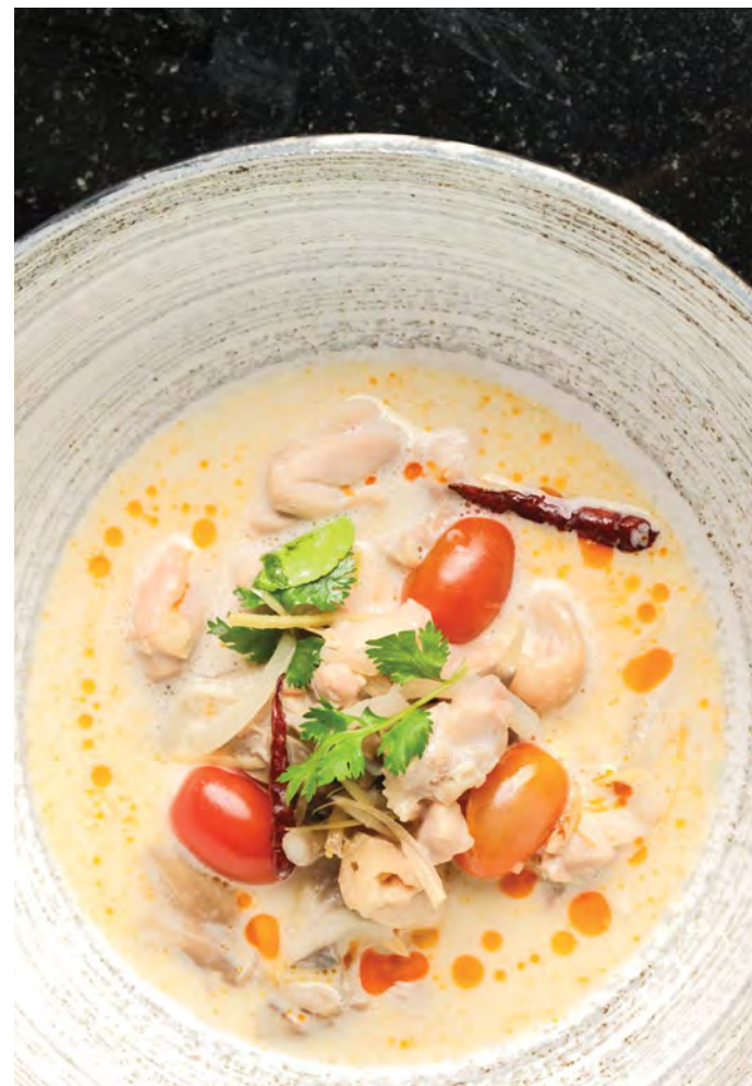
Tom Kha Cappuccino