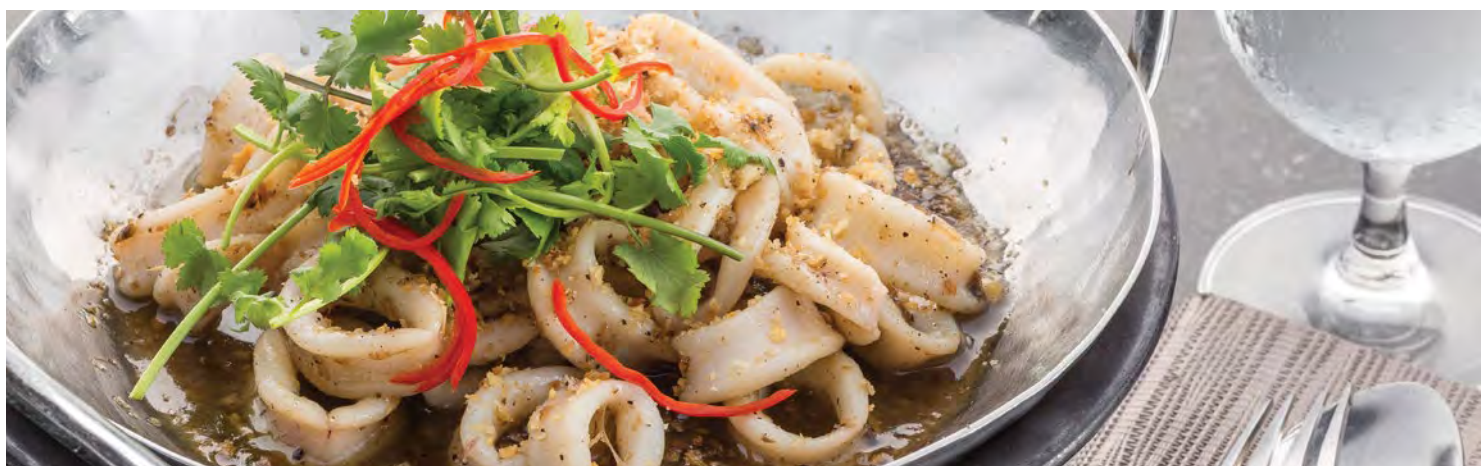
Pla Muk Thod Kratiam Prik Tai

Пожалуйста, сообщите нам если у вас есть аллергия на какие либо продукты питания или специальная диета