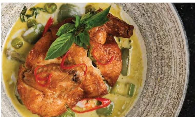
Gaeng Kiew Waan Gai