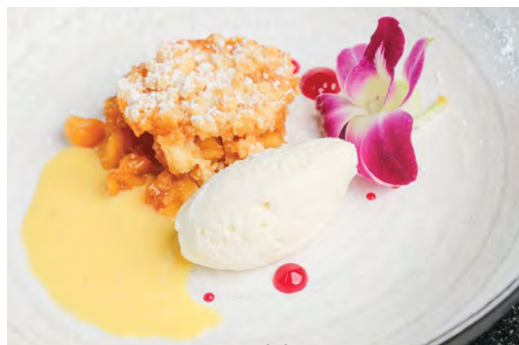
Phuket Pine Apple Crumble