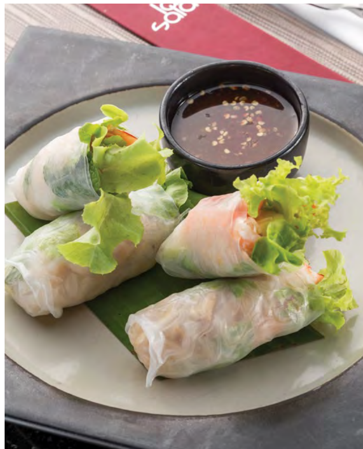
Por Pia Goong Sod