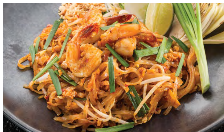
Phad Thai Goong Sod