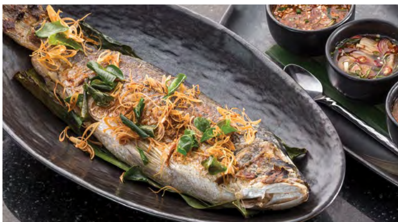
Pla Grapong Yang